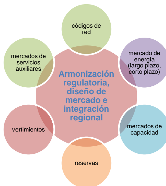
Diagrama 11 Elementos a considerar en la planificación para alcanzar una armonización regulatoria y un diseño de mercado apropiado