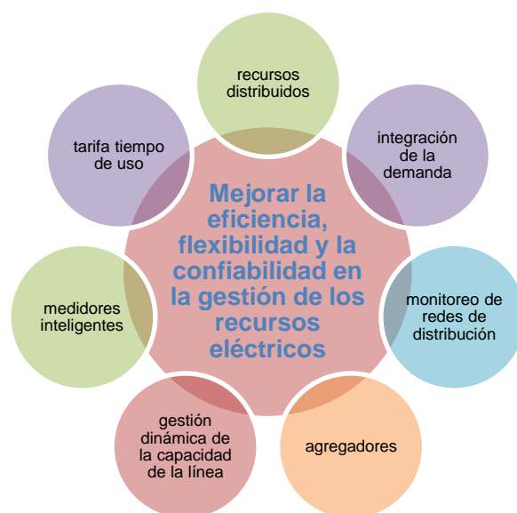
Diagrama 5 Elementos a considerar para modernizar la red eléctrica, mejorar su eficiencia y confiabilidad

El diagrama 5 identifica los elementos claves seleccionados que contribuyen hacia el logro de una mayor eficiencia y confiabilidad en la gestión de los recursos eléctricos.