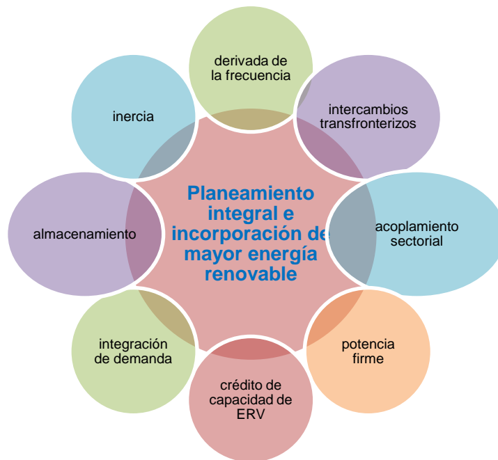
Diagrama 9 Elementos a considerar para un planeamiento regional integrado con mayor penetración de energías renovables

El diagrama 9 expone los elementos identificados que contribuyen a un planeamiento integral y la incorporación de mayor energía renovable.