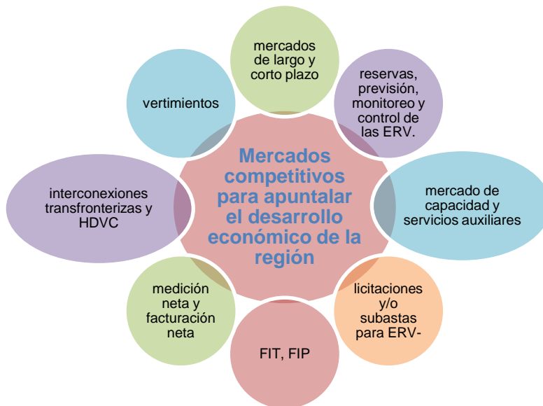
Diagrama 3 Elementos a considerar que fomentan mercados competitivos de energías renovables e integración regional

Como solución o medida de corto plazo a los antecedentes expuestos se requiere un mercado eléctrico competitivo que integre un buen diseño de mercado que permita aumentar la participación de las ERV en la matriz eléctrica, así reducir los precios mayoristas de la electricidad. A continuación se detalla cómo ciertos elementos claves, mostrados en el diagrama 3, aportarían al establecimiento de este mercado competitivo. El diagrama muestra los elementos seleccionados del documento de elementos claves para la transición energética (el cual se ha utilizado para la identificación prácticas regulatorias, operativas y de planificación en los países analizados), los cuales contribuyen a generar mercados competitivos de ER y al desarrollo económico de la región (la definición para cada uno de los elementos está detallada en el documento).