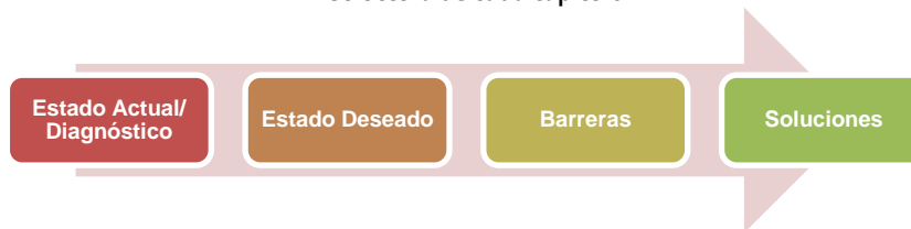
Diagrama 2 Estructura de cada capítulo

Frente a los pilares expuestos, se identifican experiencias de ocho países de ALyC a modo de dilucidar mejores prácticas y proponer soluciones a seguir en temas atinentes a los cinco puntos antes mencionados. En cada capítulo se realiza un diagnóstico para constatar la situación actual de los países analizados, vinculando sus prácticas con elementos claves identificados y exponiendo cuáles serían los impactos que supondrían estas macro soluciones. Cada capítulo se estructura como se plantea en el diagrama 2.